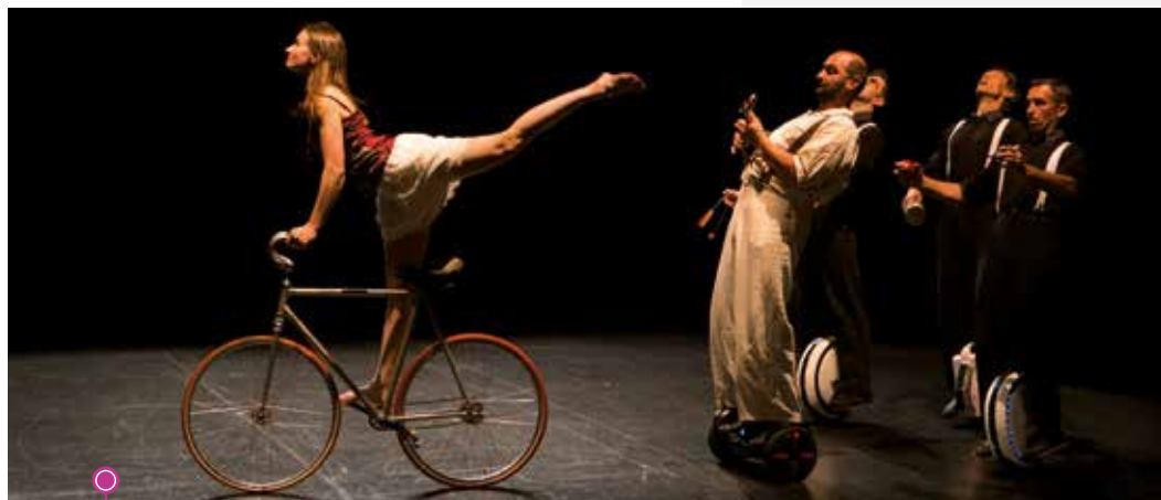
Excentriques, le nouveau spectacle des Acrostiches

Ouverture de saison avec EXCENTRIQUES, le nouveau spectacle des Acrostiches dimanche 25 septembre (16 h : jeu de saison / 17 h : spectacle / après le spectacle : grand buffet à partager).