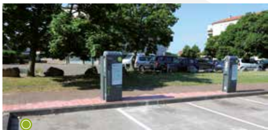
Station de recharge électrique, située rue des Frênes (secteur des Balmes)