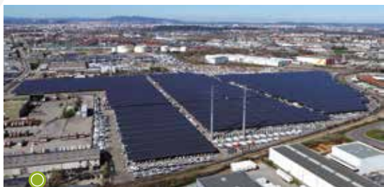
Parc d'ombrières photovoltaïques Neoen