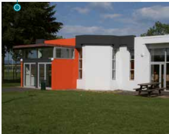
La salle de réception au Parc de Loisirs