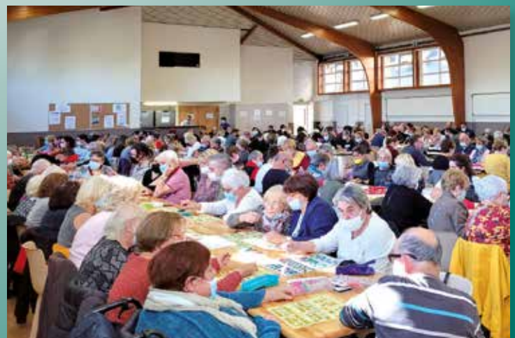
Loto du Comité pour nos anciens le 17 octobre 2021