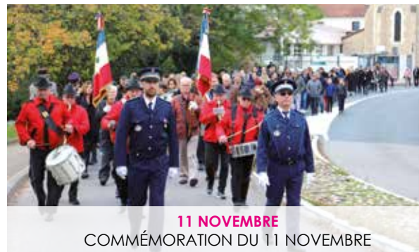
11 NOVEMBRE COMMÉMORATION DU 11 NOVEMBRE