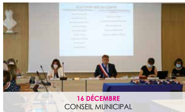
16 DÉCEMBRE CONSEIL MUNICIPAL