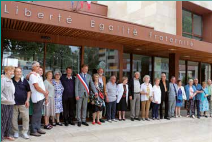
11 couples présents lors de la cérémonie des Noces du 3 juillet