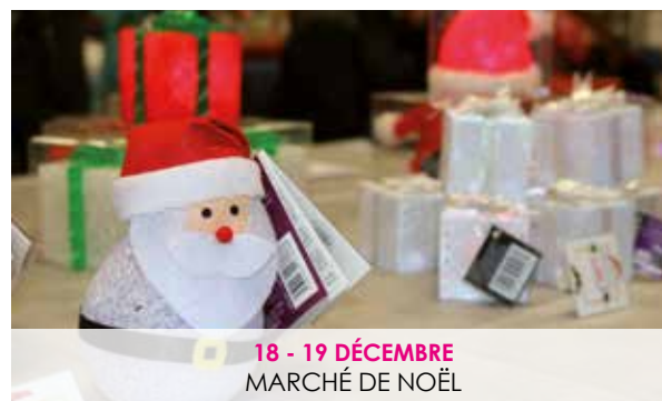
18 - 19 DÉCEMBRE MARCHÉ DE NOËL