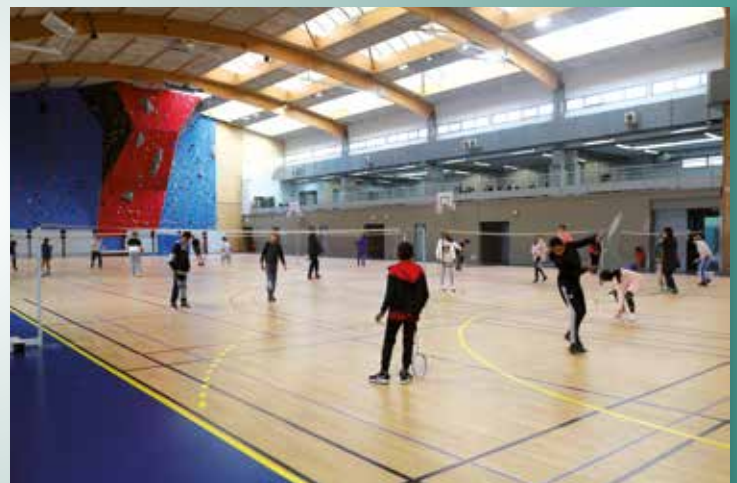
Journée nationale du sport scolaire le 22 septembre