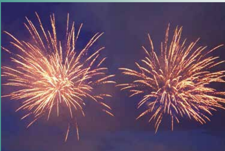
Feu d'artifice du 13 juillet