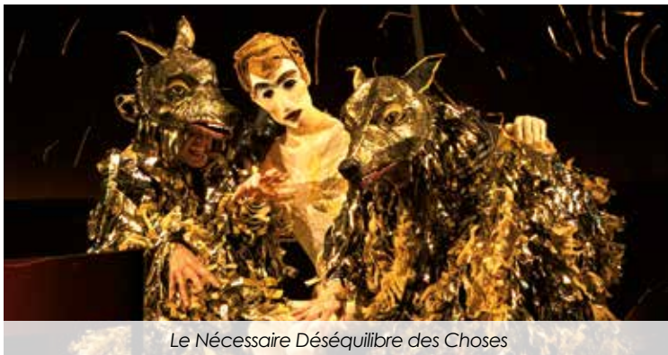
Le Nécessaire Déséquilibre des Choses

Le théâtre est heureux de vous accueillir à nouveau pour partager ensemble cette saison foisonnante !