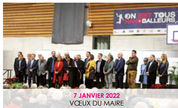
7 JANVIER 2022 VŒUX DU MAIRE