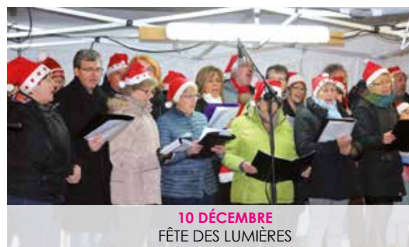
10 DÉCEMBRE FÊTE DES LUMIÈRES