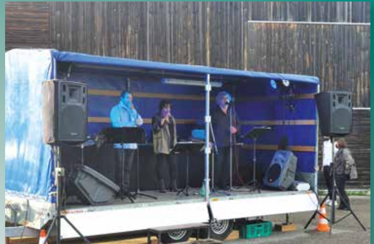
Animation musicale lors de la soirée du 13 juillet à l'occasion de la Fête Nationale