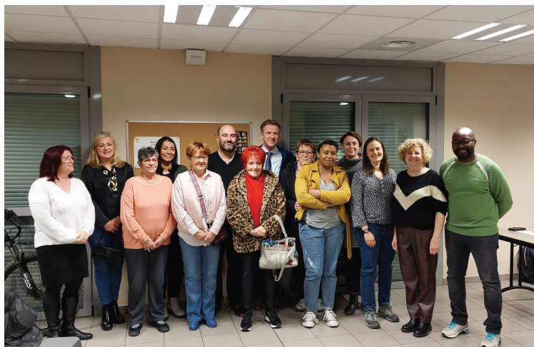
Installation du bureau du conseil de quartier les Balmes