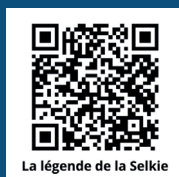
La légende de la Selkie