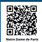
Notre Dame de Paris